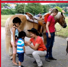
◀ Auch für die Kleinen Gäste ist gesorgt.