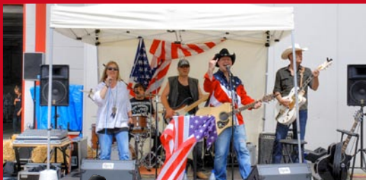
◀ Die Westernband „Wild Wallers“ aus Kassel heizt ein.

Im 50. Jahr ihres Bestehens überraschte die Schweitzer Verkaufseinrichtungen GmbH + Co.KG mit einem Event der ganz besonderen Art. Am Samstag, dem 5. Juli, lud sie nämlich von 11 bis 18 Uhr zu einem stilechten Wild-West-Barbecue für Mitarbeiter auf ihr Fimengelände in der Industriestraße 12 in Nörten-Hardenberg ein. Dort erwarteten die Mitarbeiter viele Attraktionen für die ganze Familie, wie z. B. Bull Riding, Ponyreiten oder die Line Dance Gruppe „Mountain Stars“. Natürlich fehlte ebenso wenig ein schmackhaftes Barbecue wie ein großzügiges Getränkeangebot. Bei schönem Wetter freuten sich entsprechend viele Gäste darüber, dass zumindest an diesem Tag der Wilde Westen gleich hinter Göttingen anfing. ■